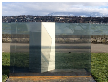
Mai 2014 , 2014, tirage, film polyester encapsulé, verre sécurisé, acier, 300 x 300 x 180 cm

Le travail d'Aurélie Pétre questionne l'image, son statut, sa (re) présentation, son utilisation et son processus de production. L'artiste utilise la photographie comme le point de départ d'une oeuvre en devenir. « J'appelle 'photographie' une prise de vue latente activée en tant que tirage, objet photographique, installation in situ donnant ainsi une taille, un poids qui existe dans un espace » (Aurélie Pétre).