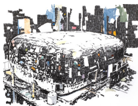
Mémoire d'architecture, le songe de Beyrouth V , 2016, crayon et aquarelle sur papier, 40 x 50 cm

Jours publics: Vendredi 22 au samedi 24, de 15h30 à 21h30