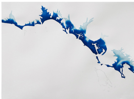
Marie Velardi, Terre-Mer (Thaïlande 1) , 2017, crayon et aquarelle liquide sur papier, 57 x 76 cm