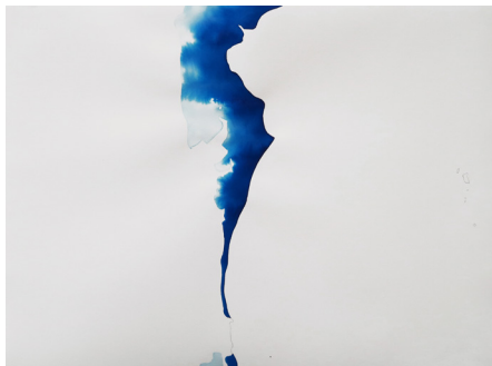
Marie Velardi, Terre-Mer (Thaïlande 3) , 2017, crayon et aquarelle liquide sur papier, 57 x 76 cm