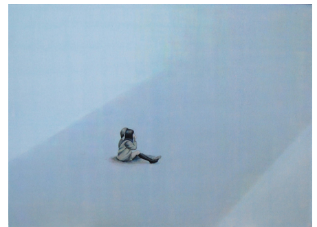
Tami Ichino, Sans titre , 2008, acrylique sur toile, 80 x 110 cm

Intéressée par ce que l'on ne voit pas mais qui existe, Tami Ichino soulève également la question des sens : les subtils dialogues entre les couleurs et les formes se veulent un échos de notre intériorité.